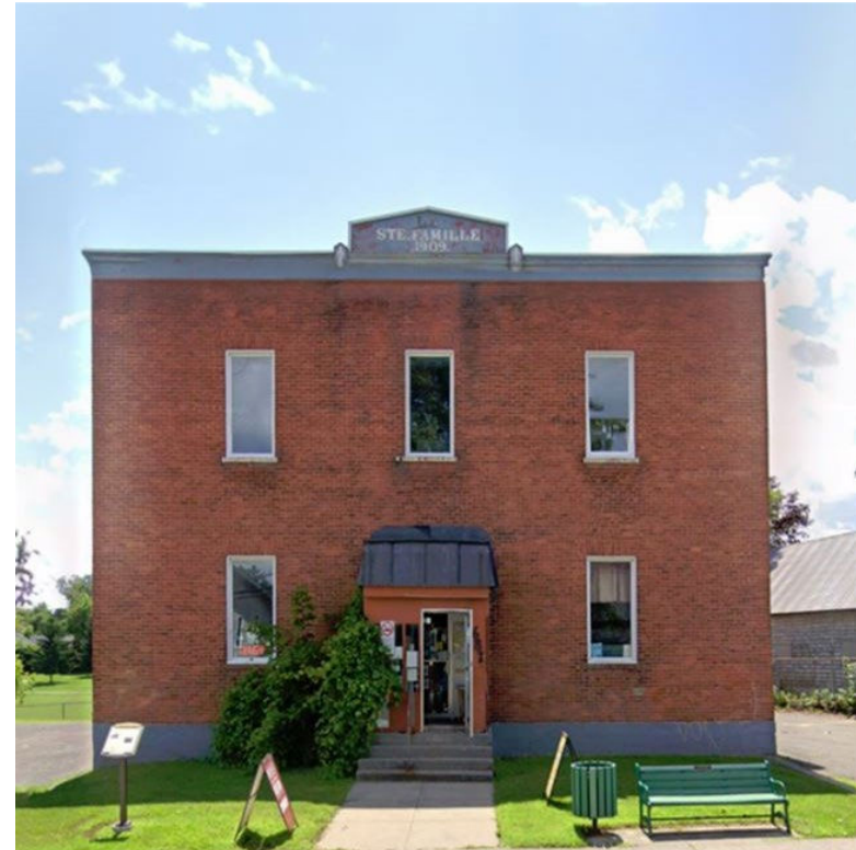
Le Musée de Clarence-Rockland

En 2010, l'édifice de deux étages a été transformé en musée grâce à l'initiative bénévole de Gilles Chartrand, qui a reconnu l'opportunité qu'offraient les locaux vacants pour contribuer à la mémoire collective et la fierté de Clarence-Rockland. Il y a apporté une sélection d'antiquités personnelles, d'objets vintage et de matériaux historiques, posant ainsi les premières pierres d'une collection qui n'a cessé de s'enrichir depuis.