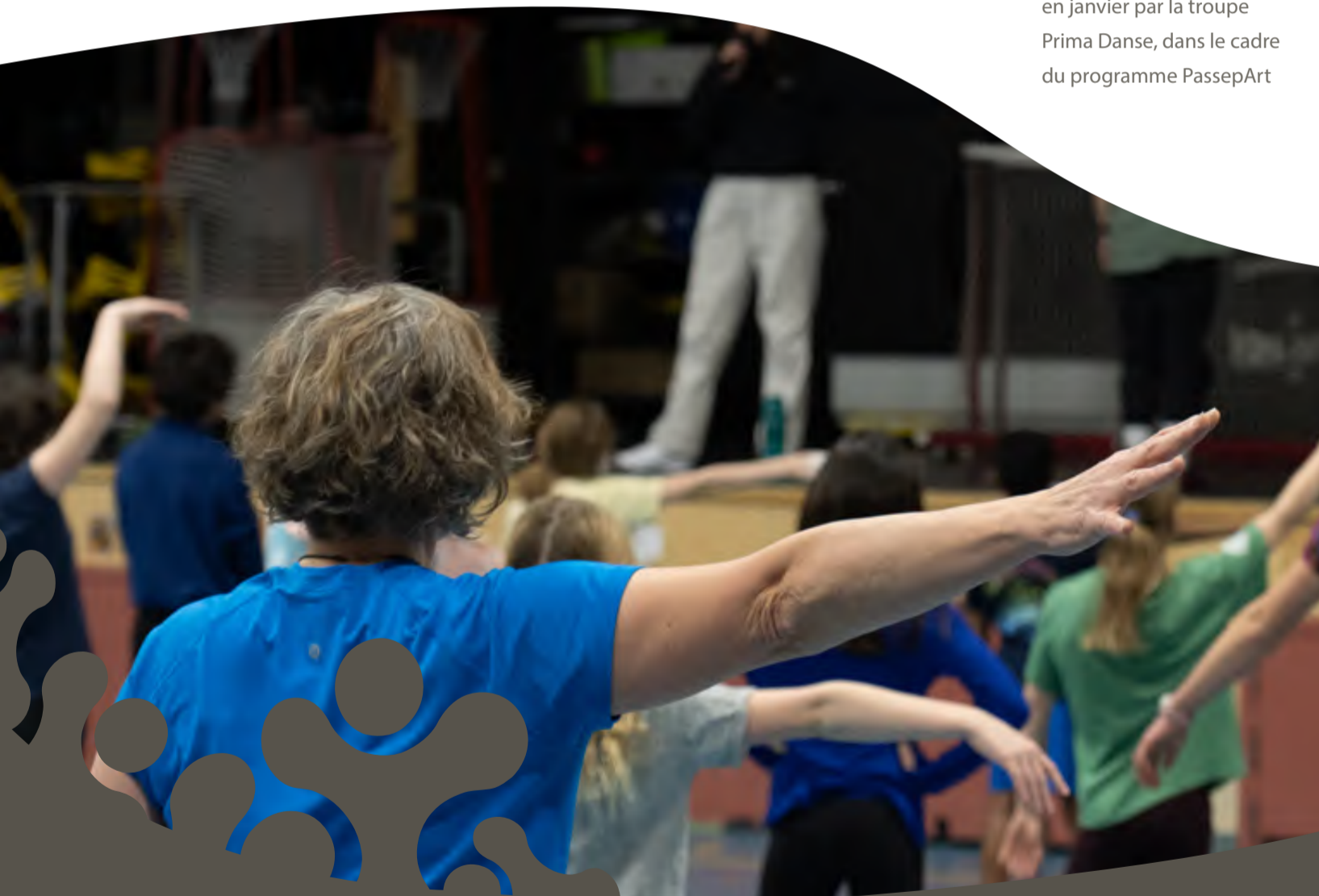
Ateliers de danse animés en janvier par la troupe Prima Danse, dans le cadre du programme PassepArt

Rapport d'inscriptions dans les établissements de la CSFY *En date du 12 août 2024