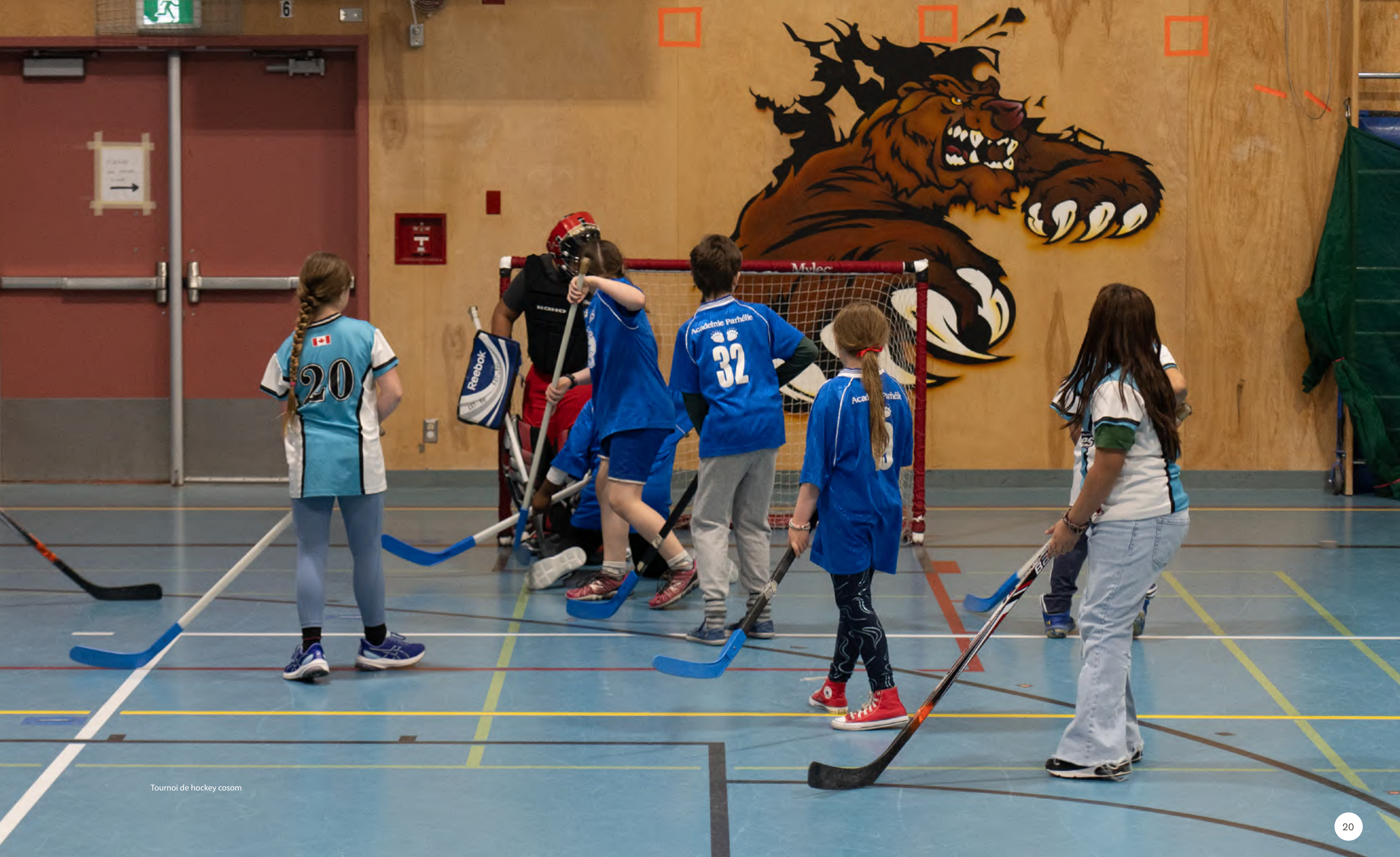
Tournoi de hockey cosom