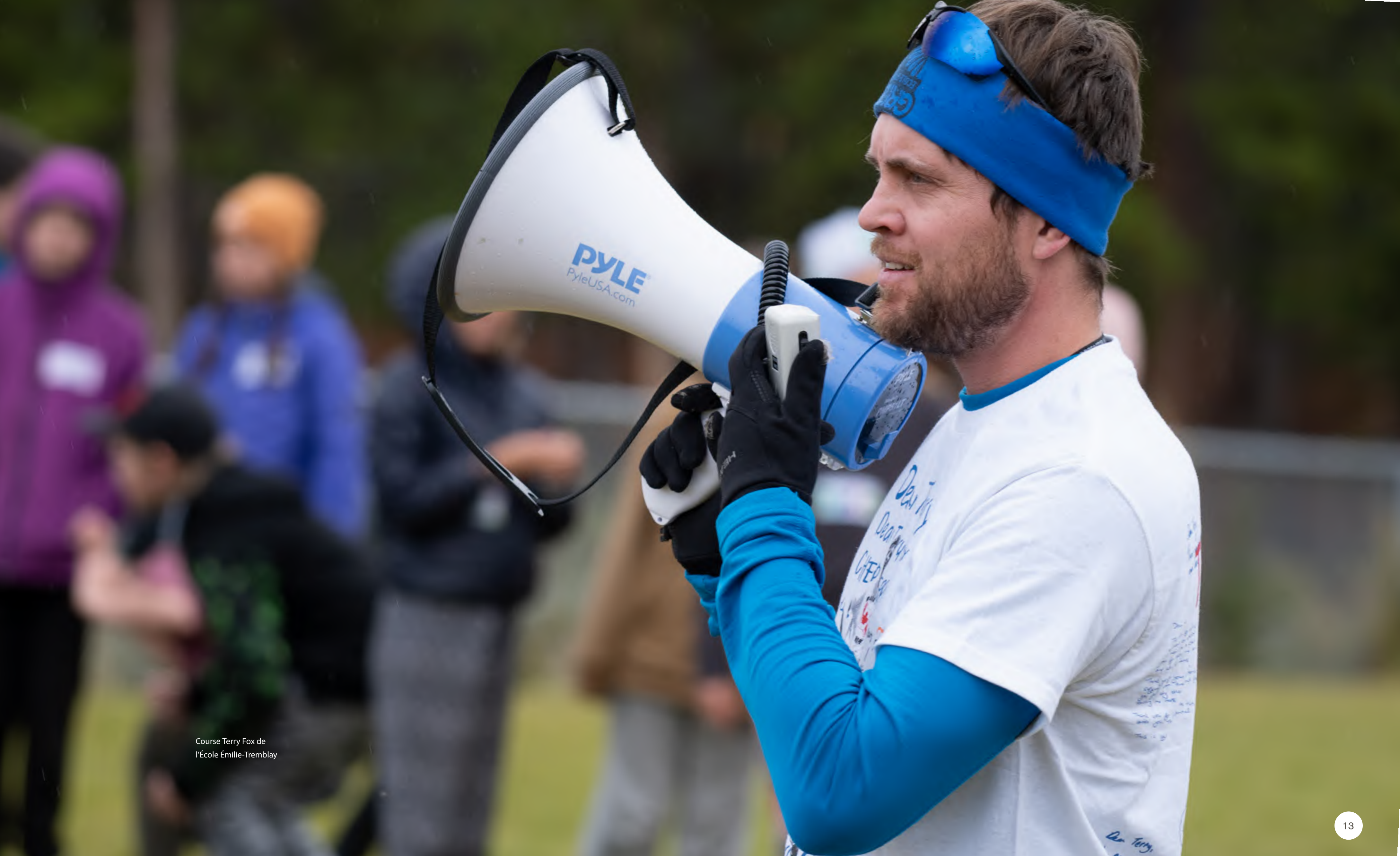
Course Terry Fox de l'École Émilie-Tremblay